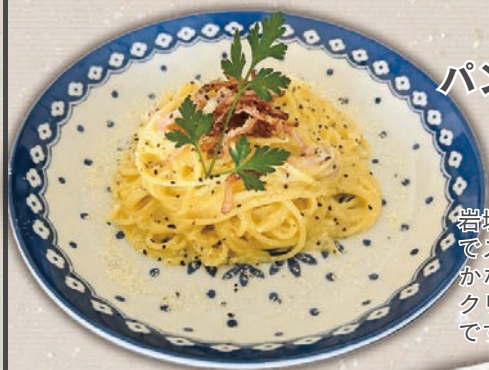
パンチェッタの カルボナーラ