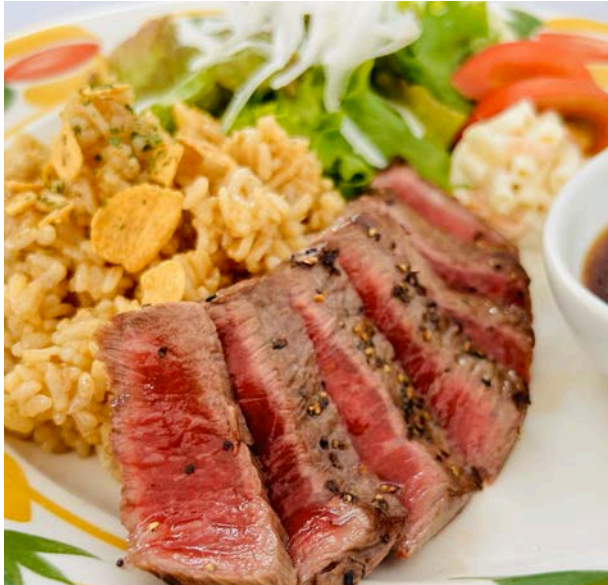
黒毛和牛のステーキ