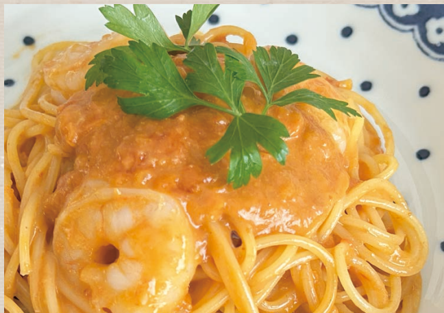
国産ズワイガニと 海老のアメリケーヌソース