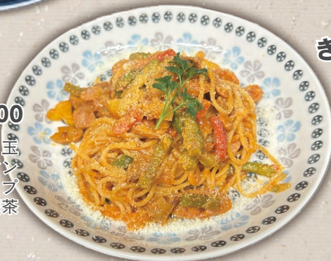
きのこの チーズクリーム

ウインナーとベーコン、玉ねぎ、にんじん、ピーマンを炒め、トマトケチャップで仕上げた昔懐かしい喫茶店のナポリタンです。