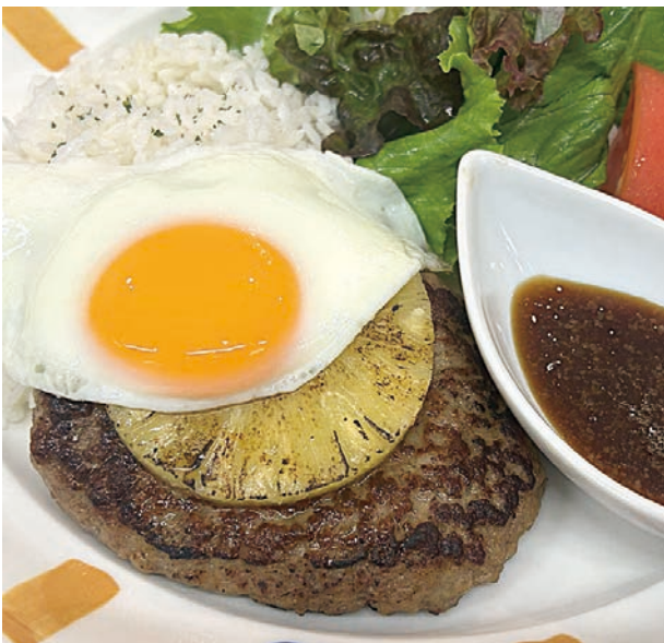
ハワイアン ロコモコ

クミンの香りが食欲をそそるスパイシーなキーマカレー。ひき肉と野菜を炒めて仕上げた、パラッと香ばしい一品です。