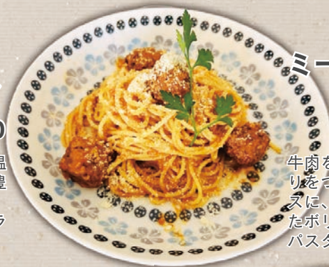
ミートボールの ボロネーゼ

岩塩に漬けて熟成し、低温でスモークをかけた風味豊かなパンチェッタ入りの、クリーミーなカルボナーラです。