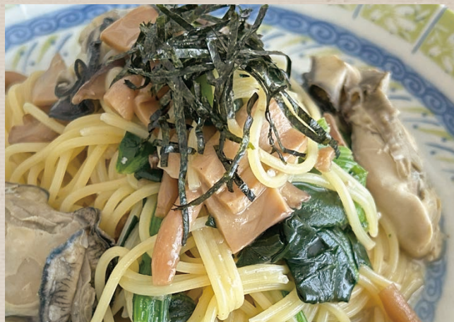
牡蠣とキノコの和風パスタ

国産の紅ズワイ蟹と海老にアメリケーヌソースと生クリームのコク、トマトの旨味を加えた、芳醇で贅沢な味わいのパスタです。